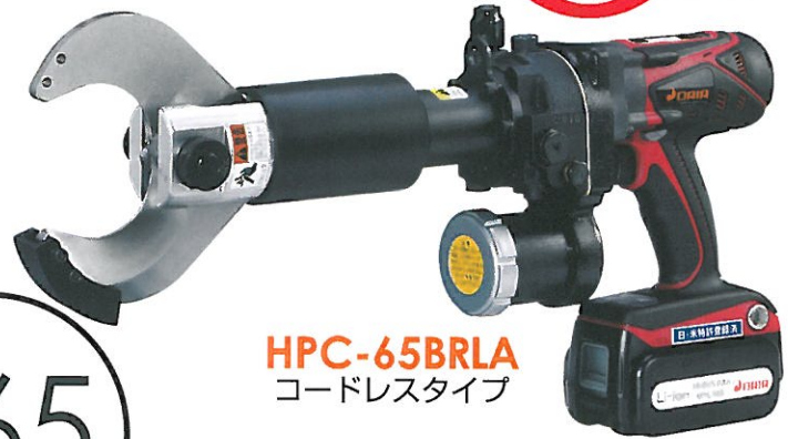
HPC-65BRLA コードレスタイプ