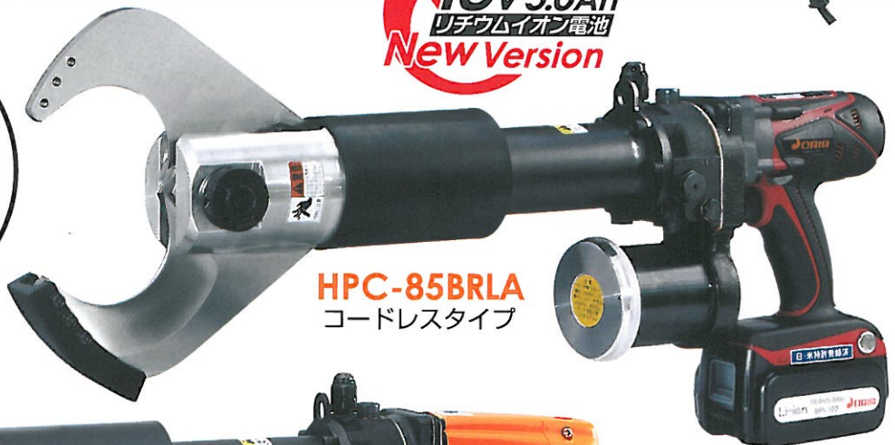
HPC-85BRLA コードレスタイプ